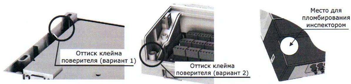
Рисунок 3 – Места пломбирования тепловычислителя