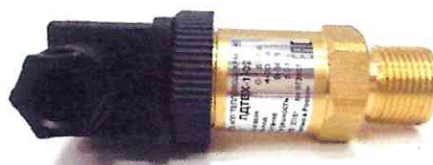
г) Преобразователь давления ПДТВХ-1