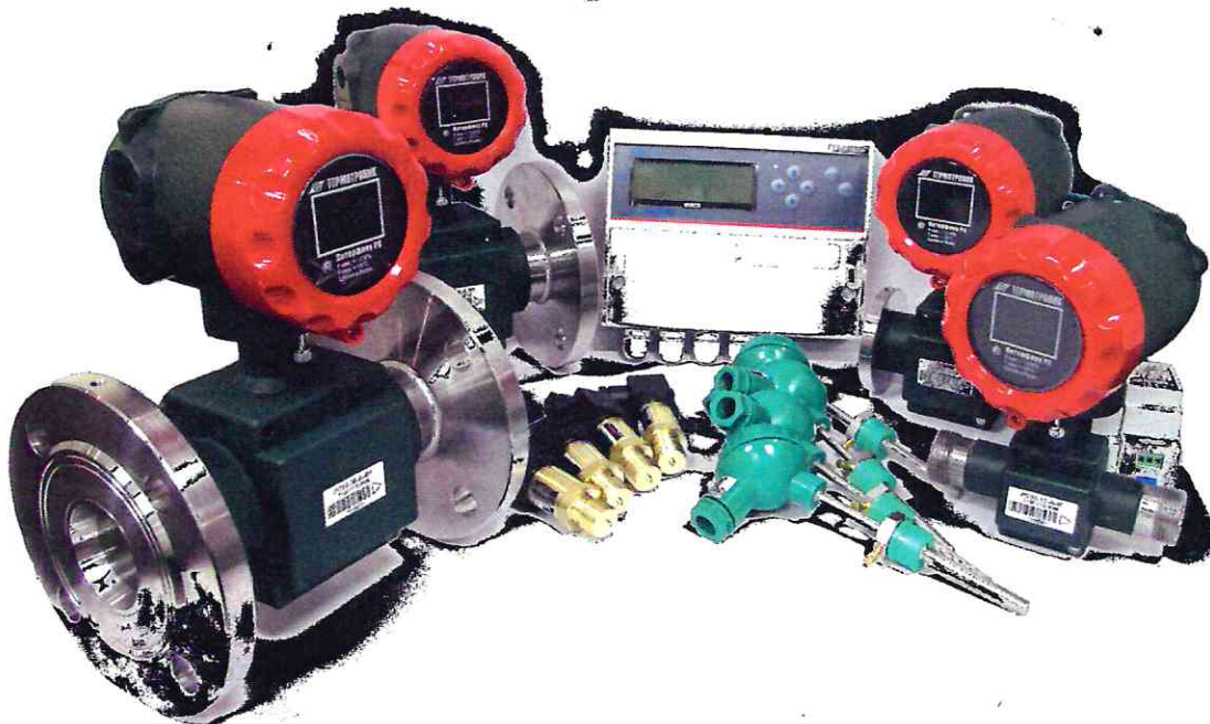
Рисунок 1 – Общий вид теплосчётчика ТЗ4М, возможная комплектация

Составные части теплосчётчика обеспечивают защиту от несанкционированного вмешательства в их работу. Способы защиты и места пломбирования приведены в описаниях типа и (или) эксплуатационной документации составных частей теплосчётчика.