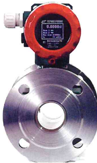
б) Расходомер-счётчик электромагнитный ПИТЕРФЛОУ