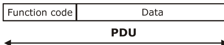
Рисунок 4: Состав PDU

Логический уровень протокола отвечает за способ доступа к данным. Протокол «Modbus» определяет понятие PDU (Protocol Data Unit), независимое от используемого коммуникационного протокола. PDU содержит 2 поля: код функции (длина 1 байт) и данные (длина не более 252 байт). Подробное описание логического уровня приведено в разделе Реализованные функции протокола .