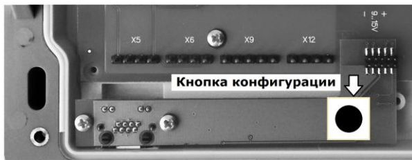
Рис. 1 Место установки адаптера Ethernet

Адаптер интерфейса Ethernet устанавливается в нижней части корпуса тепловычислителя ТВ7. Место установки адаптера показано на рис. 1.